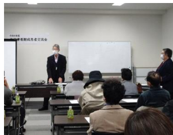
久慈市会場の様子