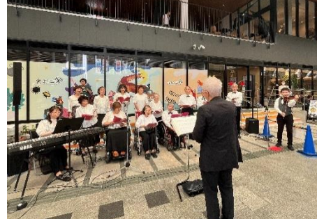
ふれあいコールの様子

日時.. 9月29日(日) 会場..プラザおでって他 難病連からはふれあいコールが出演しました。