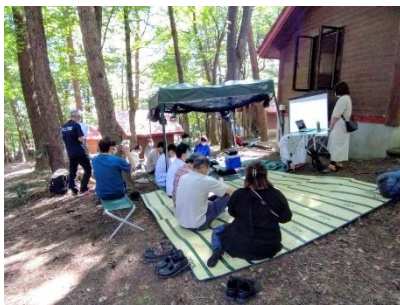
デイキャンプの様子