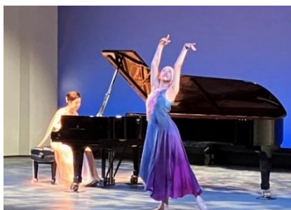
リサイタルの様子