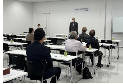
宮古市キャラバンの様子

りました。ありがとうございます。「疾病はちがいますが、色々な話を聞けて、これからの生活に生かしていきたいです。」等のお声をいただきました。