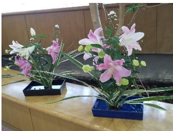
生け花教室(7月の作品)