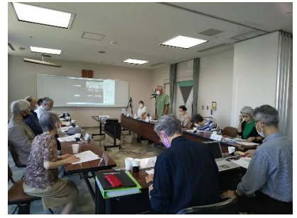
第2回理事会・代表者会議