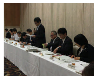
岩手県保健福祉部長との懇談会より