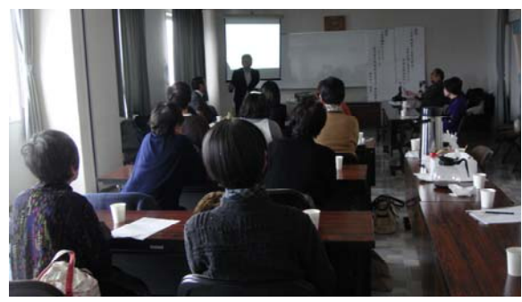
第5回医療講演会・相談会・交流会 in 盛岡